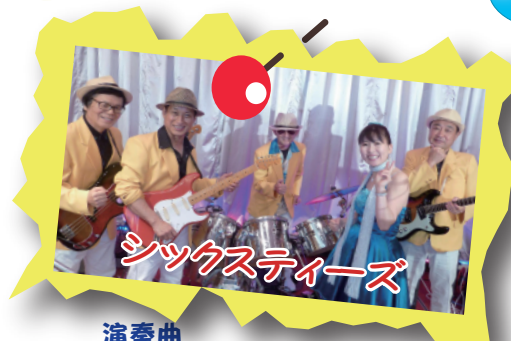
演奏曲 ダイアナ ヴァケーション パイプライン...etc