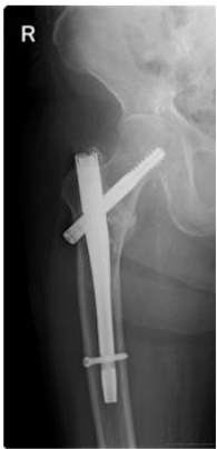
大腿骨転子部骨折