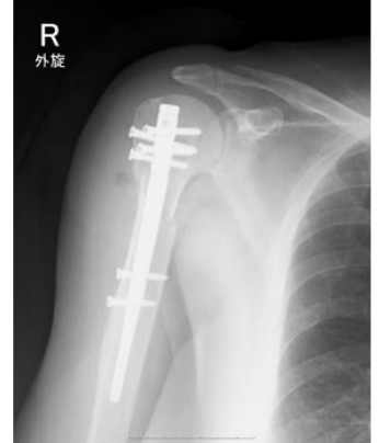
上腕骨近位部骨折